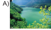
Boraboy Gölü, Amasya

Buna göre aşağıdakilerden hangisi doğal varlıklara örnek olarak gösterilebilir?