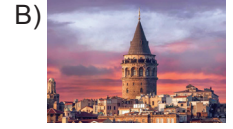
Galata Kulesi, İstanbul